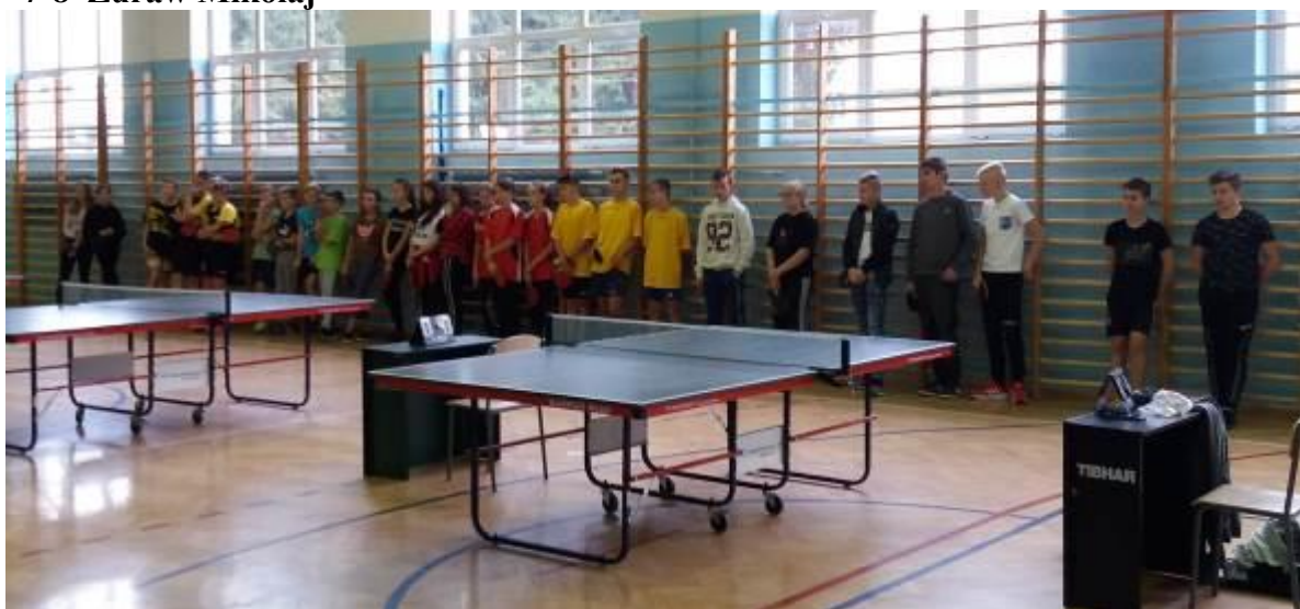
Zdjęcie grupowe wszystkich uczestników turnieju