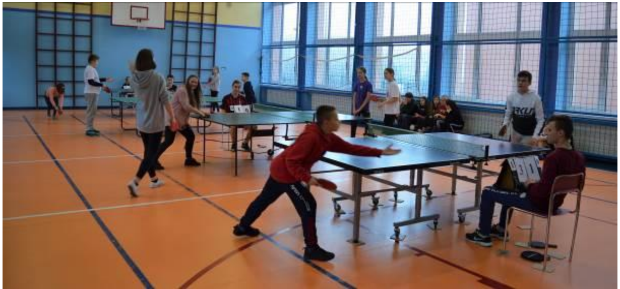
Zdjęcie w trakcie turnieju