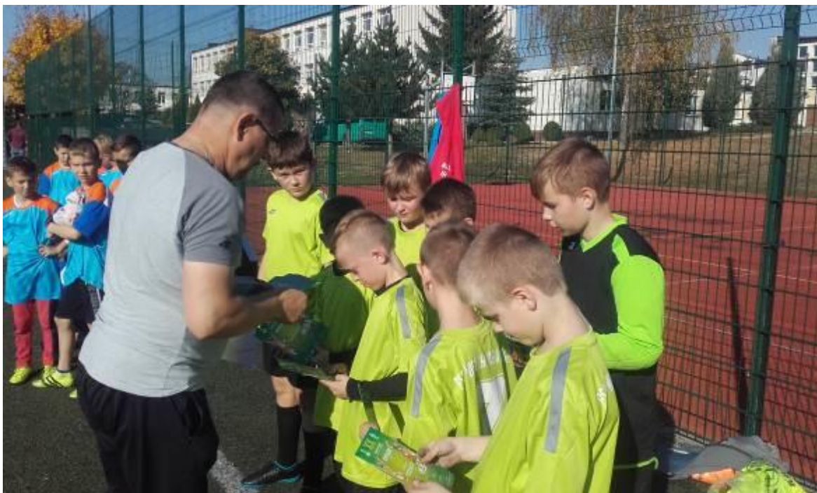
Wręczenie pamiątkowych medali i dyplom