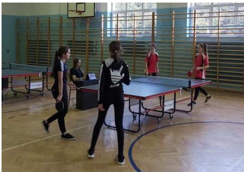
Zdjęcie w trakcie turnieju