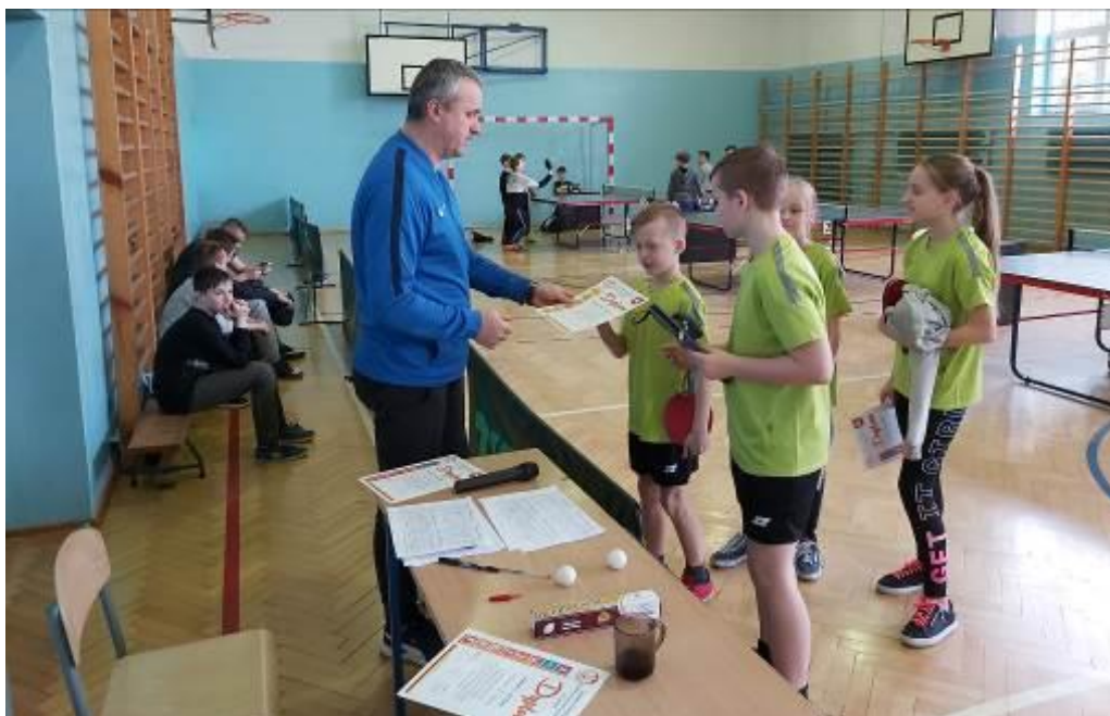
Wręczenie pamiątkowych dyplom od organizatora