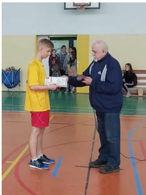
Kapitan odbiera dyplom od organizatora