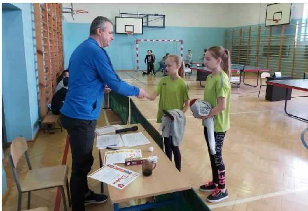
Wręczenie pamiątkowych dyplom od organizatora