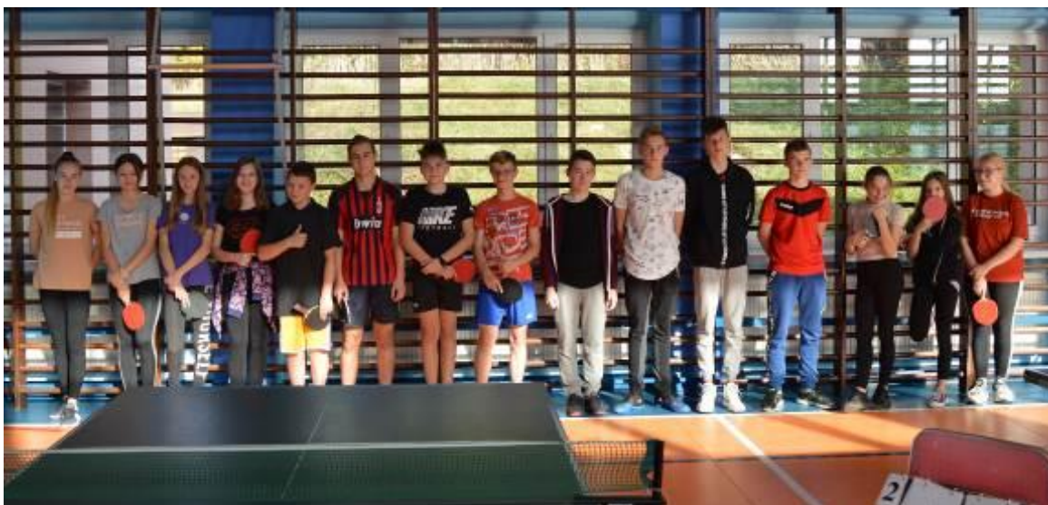
Zdjęcie grupowe wszystkich zawodników turnieju