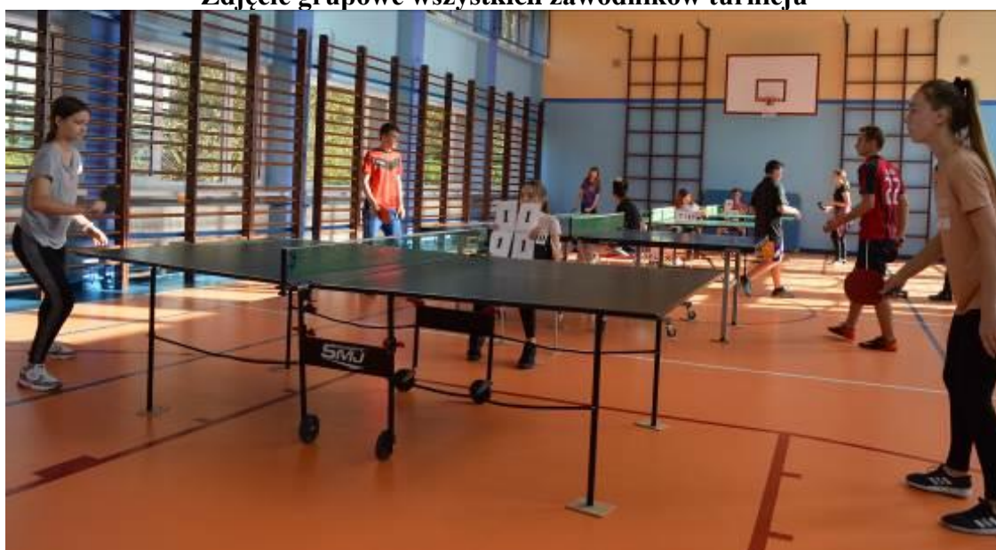
Zdjęcie w trakcie turnieju