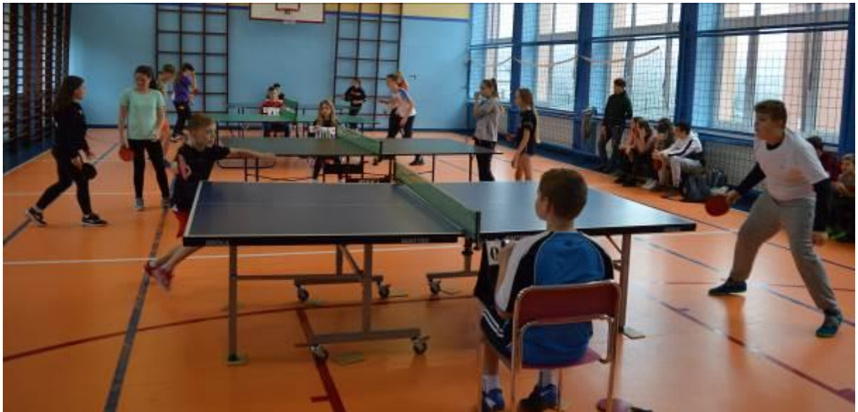
Zdjęcie w trakcie turnieju