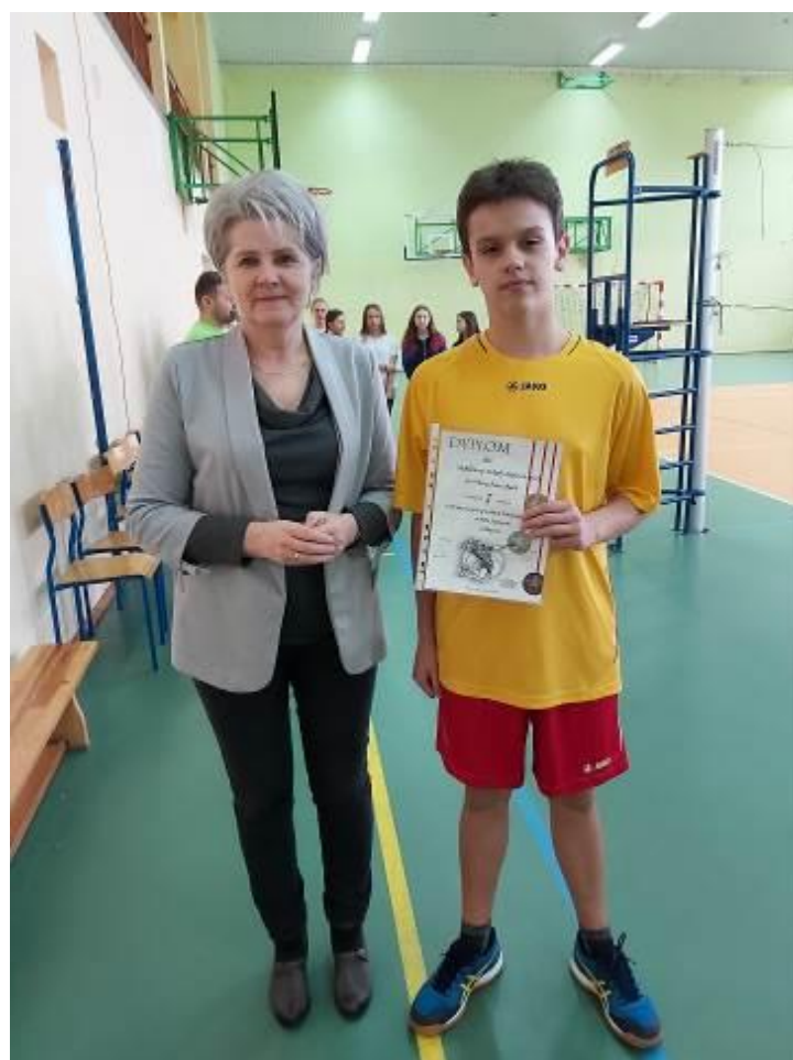
Kapitan odbiera dyplom od organizatora