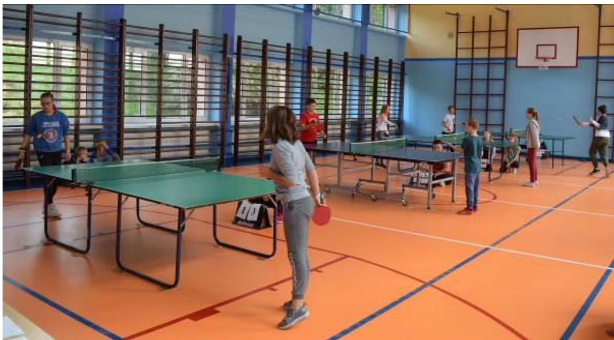
Zdjęcie w trakcie turnieju