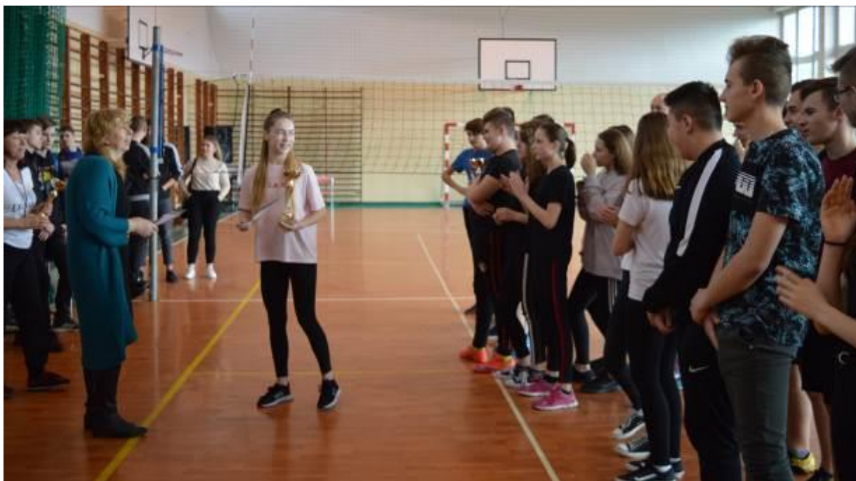
Kapitan odbiera puchar i dyplom od organizatora