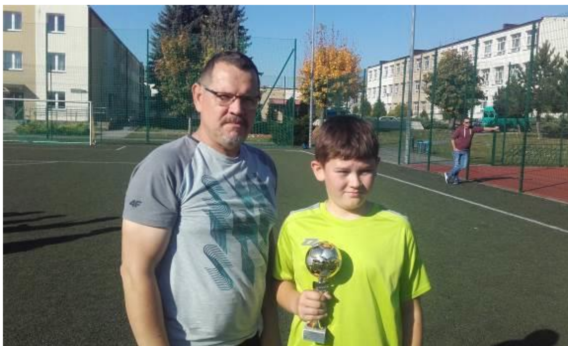
Kapitan odbiera puchar za I miejsce od organizatora