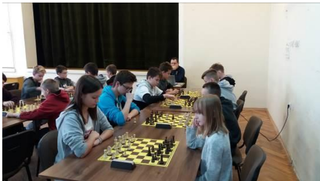
Zdjęcie w trakcie turnieju