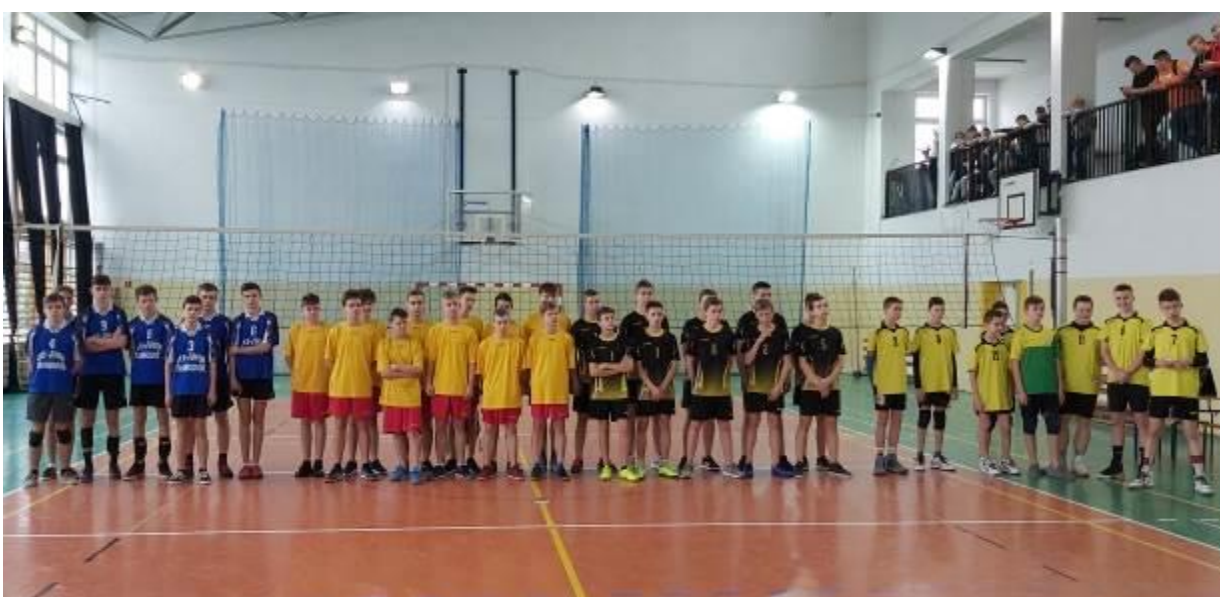
Zdjęcie grupowe wszystkich uczestników turnieju