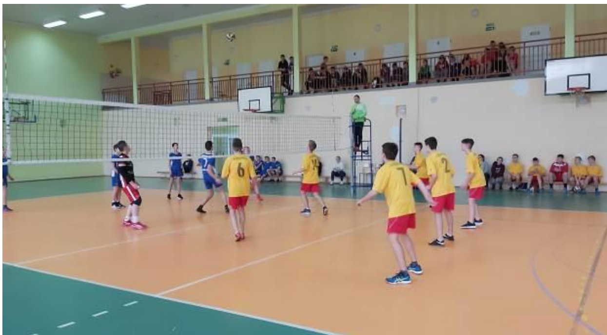
Zdjęcie w trakcie turnieju