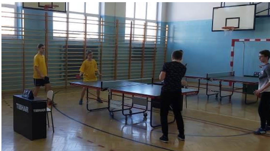
Zdjęcie w trakcie turnieju