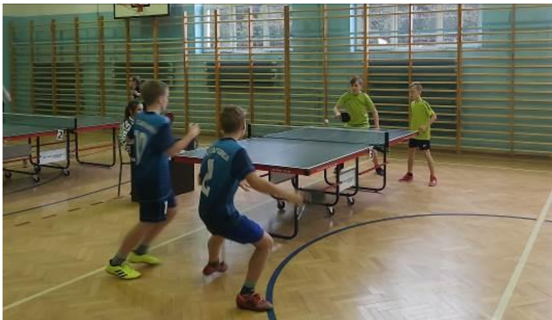
Zdjęcie w trakcie turnieju