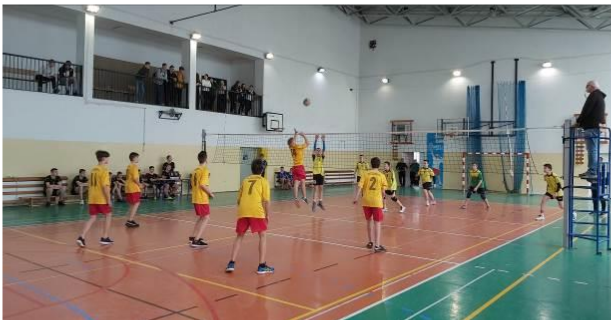
Zdjęcie w trakcie turnieju