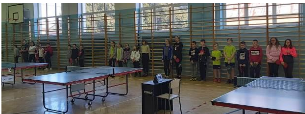
Zdjęcie grupowe wszystkich uczestników turnieju