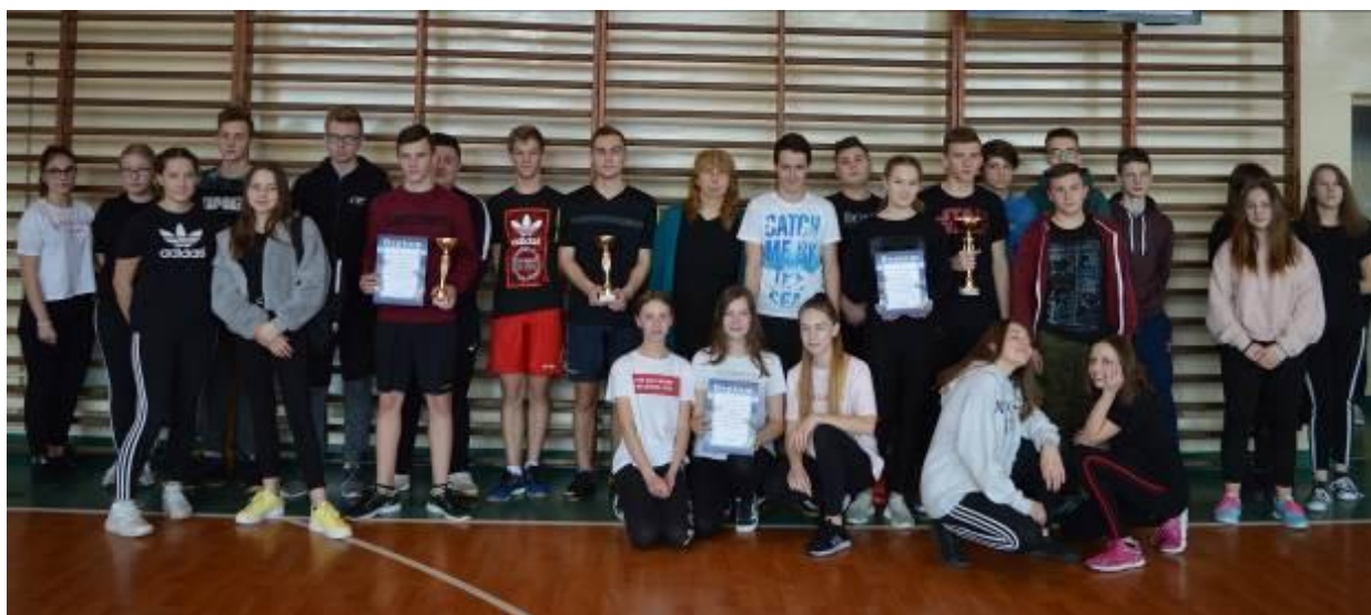
Zdjęcie grupowe wszystkich uczestników turnieju