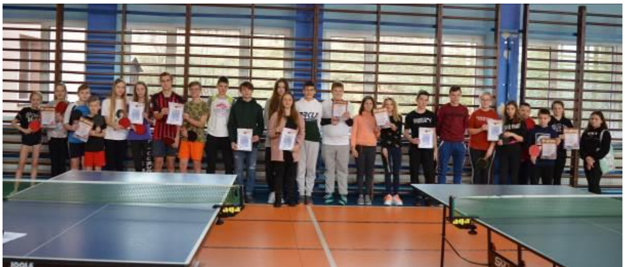
Zdjęcie grupowe wszystkich uczestników turnieju